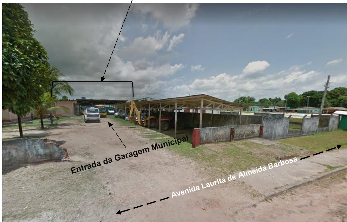
Foto 07 Área da construção da Garagem Municipal