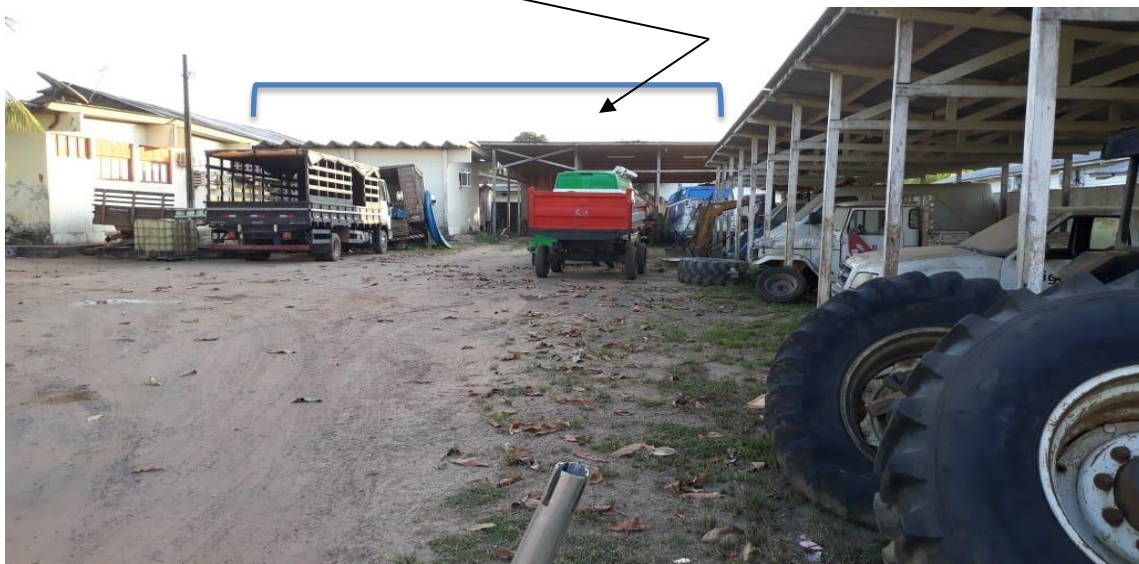
Foto 03 Área da construção da Garagem Municipal