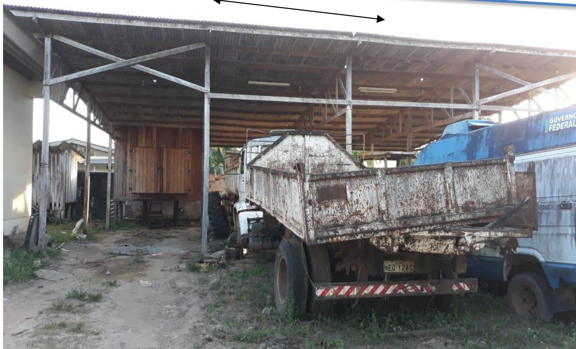
Foto 05 Área da construção da Garagem Municipal