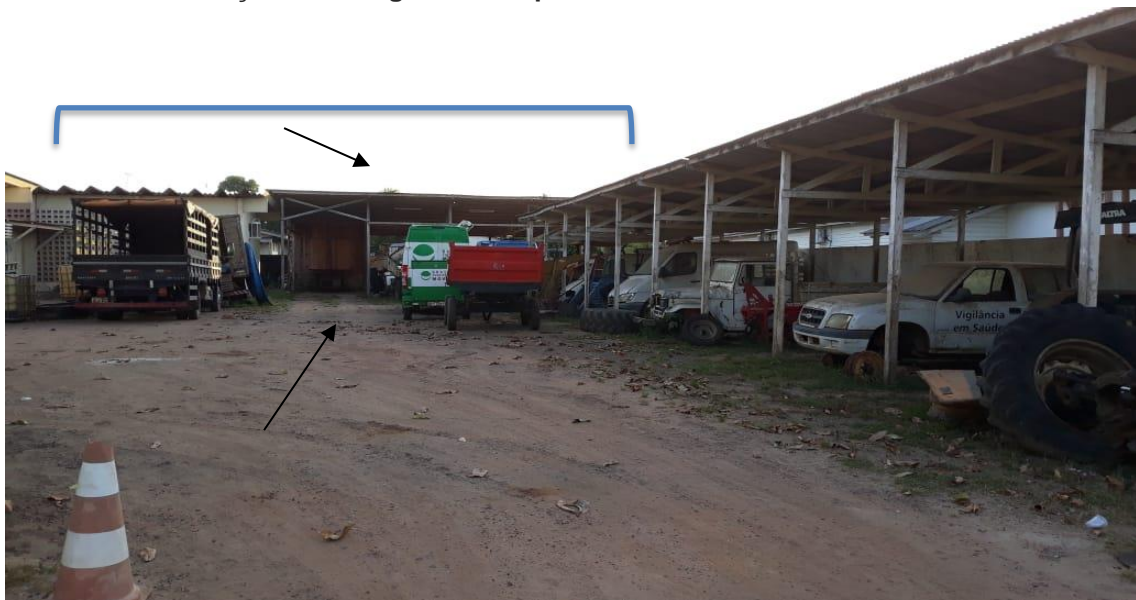
Foto 01 Área da construção da Garagem Municipal